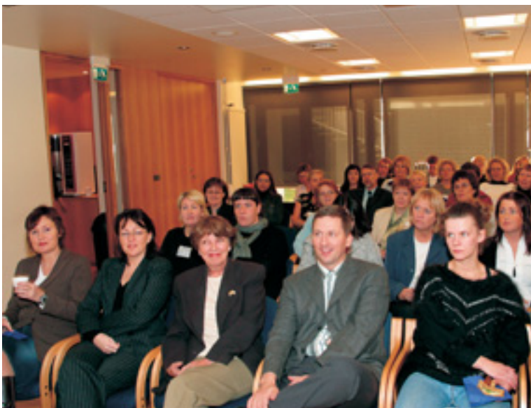
Frá fyrirlestri Sigursteins

Geðsjúkur einstaklingur á vinnustað þarf ekki á því að halda að aðrir séu sífellt að gjóa augunum til hans eða velta fyrir sér veikindum hans. Hann þarf fyrst og fremst að eignast góðan trúnað um veikindi sín. Þannig getur verið besta leiðin að vinur eða vinkona viðkomandi taki fyrsta skrefið, sú persóna sem fyrir á greiðasta leið að einstaklingnum. Þetta þarf að gerast ljúflega og áreynslulaust, jafnvel fyrir utan vinnustað. Í framhaldi af þessu kann að vera nauðsynlegt að trúnaðarmaður komi að í því skyni að koma einstaklingnum undir læknishendur.