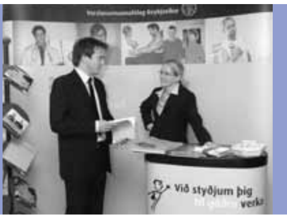
VR kynnir starfsemi sína víða.