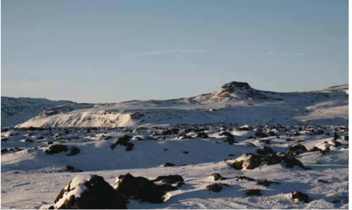
Eldhraun að vetrarlagi