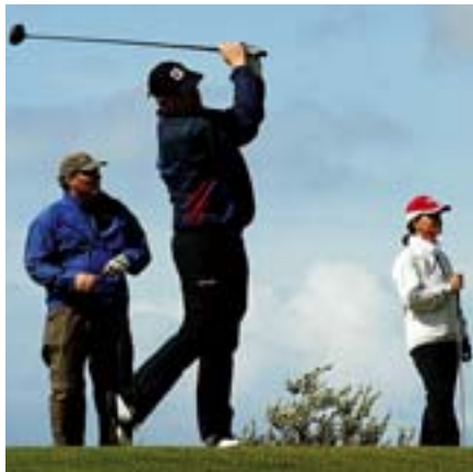
Stærsta opna golfmót sumarsins