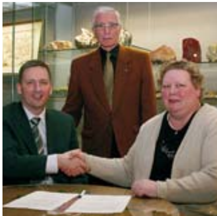
VR og VA í eina sæng