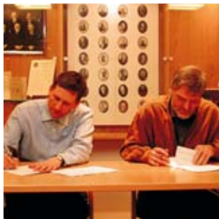
Kjarasamningur við FIS undirritaður